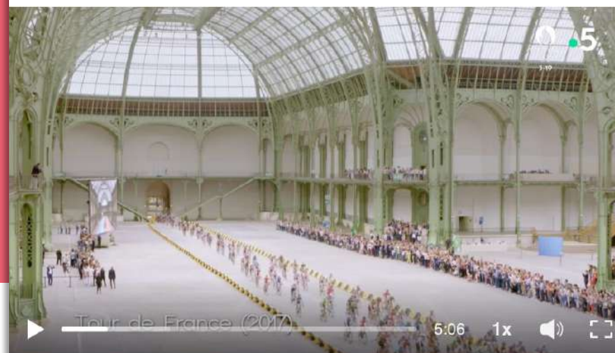
Les métamorphoses du Grand Palais 55 7 commentaires