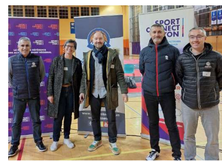
LE RÉSEAU DE RÉFÉRENCE DES ACTEURS DU SPORT RÉGIONAL