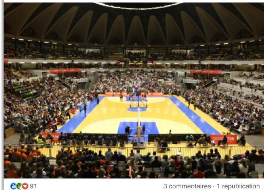
91 3 commentaires · 1 republication